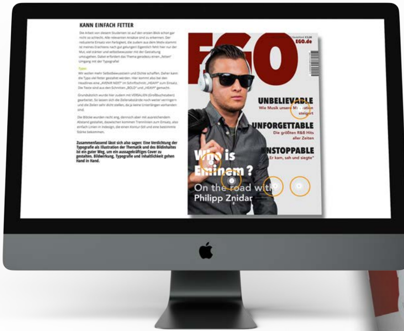
Coverbesprechung mit Tipps