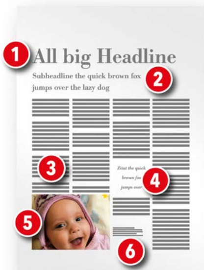
Elemente beim Seitenaufbau