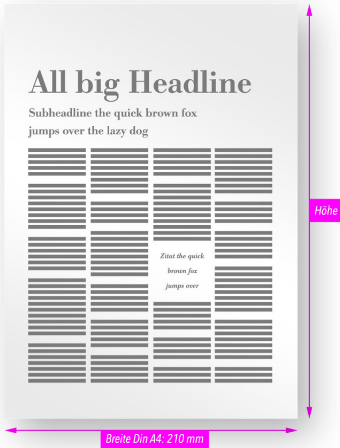
Illustrationen zum Aufbau